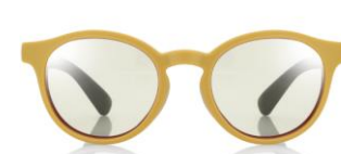
イエロー×ブラウンレンズ