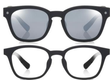
ブラック×偏光グレーミラーレンズ