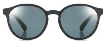
マットブラック×ネイビーレンズ