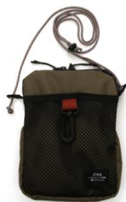
オリジナルケース

全ての商品に本コラボレーションのために制作されたオリジナルケースとセリートが付属！オリジナルケースは Snow Peak 製品で実際に使われているテント生地やテントロープなどの素材を使用したサコッシュタイプ、セリートはサコッシュに取り付けて使用できるようハトメ加工を施しました。