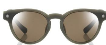
カーキ×偏光ブラウンレンズ