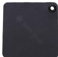
オリジナルセリート